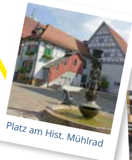
Platz am Hist. Mühlrad