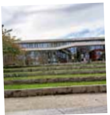
Bahnhof & Filsterrassen a. d. Stadthalle Eisingen