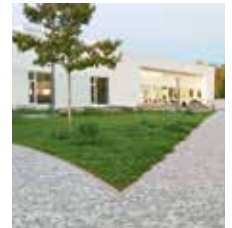
Kulturhalle Süßen (draußen)